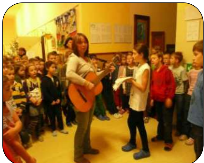
Luxusní stojánek k hudebnímu nástroji

Pěkný zvyk se v pyšelské škole dodržel i v posledních školních dnech roku 2014. Před vyučováním se děti prvního stupně shromáždily na chodbě v přízemí školy a pak se několik minut linuly celou školou naděje a příslib vyzpívané dětskými hlásky v podobě koled a vánočních písní.