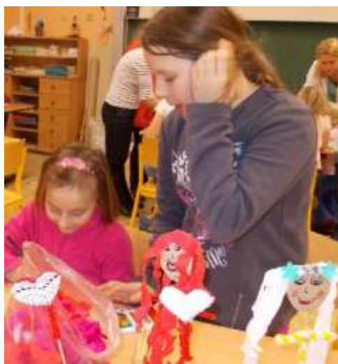
Zápichy do květináče