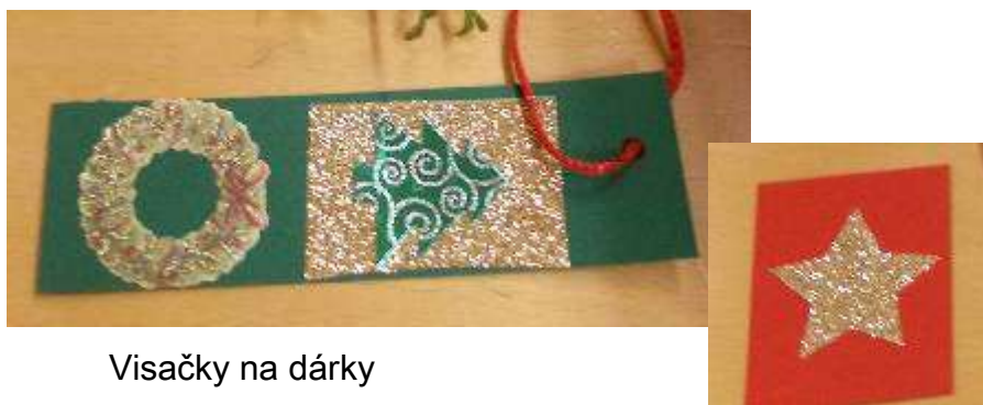
Visáčky na dárky