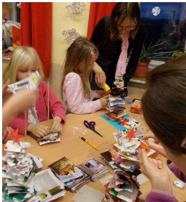
Papírový stromeček s hvězdou