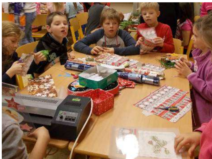
Zalaminátované ozdoby do oken