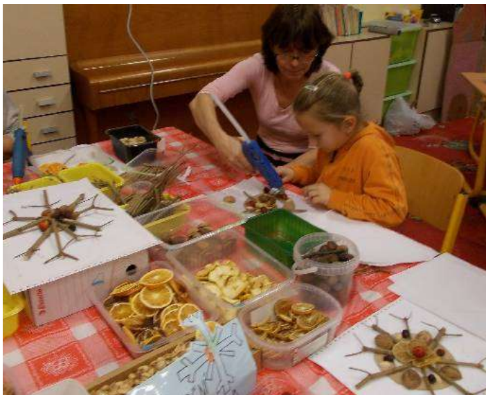
Vánoční hvězda z větvíček a sušených dobrůtek