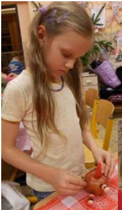
Výroba svícnu z jablka